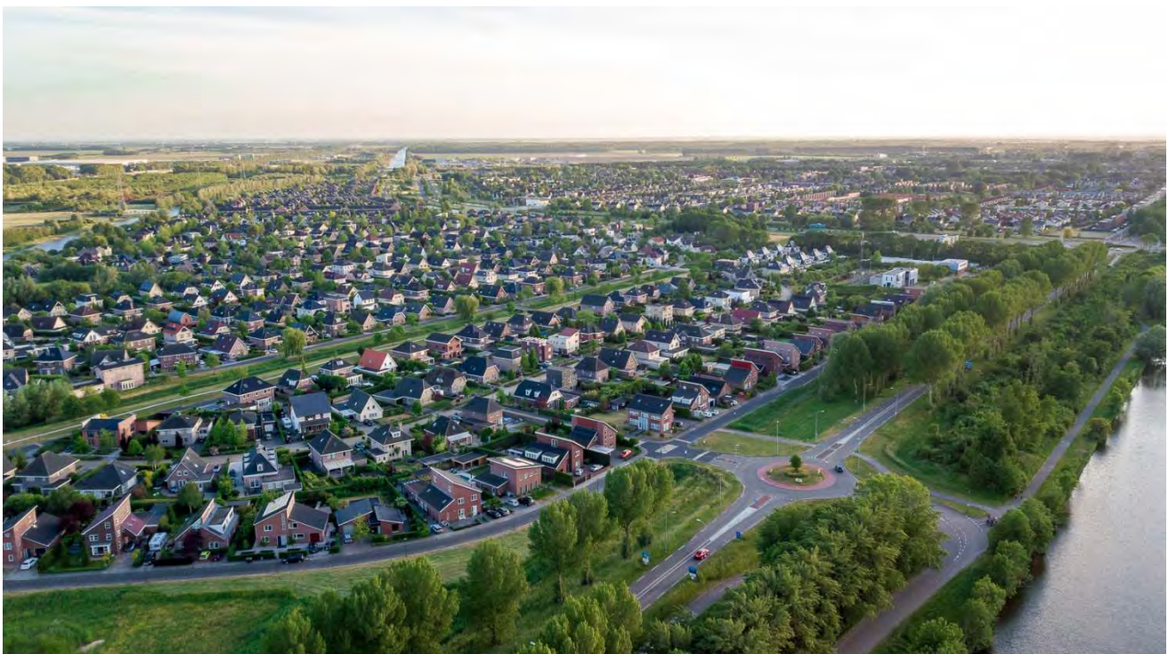
Figuur 1. Een deel van Lelystad vanuit de lucht. Foto Jasper Plum, gemaakt met een drone.

te zoeken is. Mensen die deze samenhang begrijpen moet je met een vergrootglas zoeken. Toch is ieder mens gebaat bij een evenwicht en die samenhang. Naast onderdak willen we graag eten, nu en in de toekomst, willen we geen 'plaagdieren' om ons heen en willen we ook onze eigen soort in stand houden. Wat we nu zien is dat veel mensen, ondanks dat ze uitgerust zijn met het vermogen de toekomst te beredeneren, zich alleen richten op veel hebben en krijgen op korte termijn en zich nauwelijks richten op basisbehoeften in de toekomst. Aandacht besteden hieraan is wellicht het belangrijkste element om te komen tot een behoud en ontwikkeling van een evenwichtig stedelijk ecosysteem. Waarom moet alles kaal en strak zijn? De huidige aandacht voor bijen zou wel eens de belangrijkste drager kunnen worden om het denken van een groter publiek te veranderen. Je gelooft het niet, maar ik ontmoet nog steeds veel mensen met kennis, die zich er over verbazen dat 'bijen' niet synoniem is met 'honingbij'. Ze denken dat de biodiversiteit stijgt als je een imker kasten met honingbijen laat plaatsen.... En wat te denken van iiiiii een wesp? Meteen een bestrijdingsbedrijf bellen,