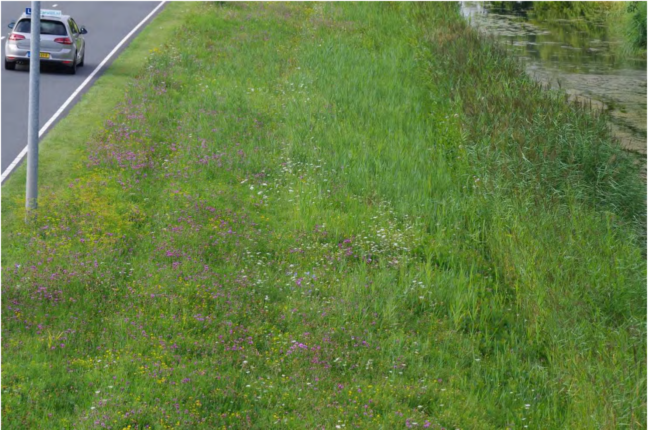
Figuur 4. Een bloemrijke berm op voedselrijke grond.

de coalitie vormen. Om een onderwerp op de agenda te krijgen is het dus handig om met raadsleden van grote partijen te spreken en het belang van insecten en bijen in de stad onder de aandacht te brengen. De kans bestaat dan dat insecten in het raadsprogramma komen of op de een of andere manier aan een ander onderwerp gekoppeld worden. Spreek ook met partijen waarvan je in eerste instantie denkt dat die niets met het onderwerp hebben. Vaak is er een raadslid van die partij die er wel iets mee heeft of passen bijen op een andere manier binnen hun scope (minder beheerkosten, economische waarde, etc.). Buiten de verkiezingstijd is het ook nuttig om met raadsleden te spreken. Zij kunnen, zoals eerder genoemd, een motie indienen om aandacht te vragen voor bijen en ongewervelden. Zowel coalitiepartijen als de oppositie kunnen vragen stellen in de raadsvergaderingen. Sommige gemeenten houden een kennismakingsbijeenkomst met nieuwe raadsleden. Dit is de kans om te kijken welke raadsleden interesse hebben in het verhaal van de bijen en insecten. Deze kun je dan later nog eens benaderen met ideeën of voorstellen. In sommige gemeenten is er zoiets als een motiemarkt. Inwoners en verenigingen kunnen dan voorstellen indienen die als motie behandeld worden. Er is dan vaak ook eenmalig geld voor uitvoering (niet voor structurele kosten, dus interessant voor een project). Politieke partijen omarmen een idee en