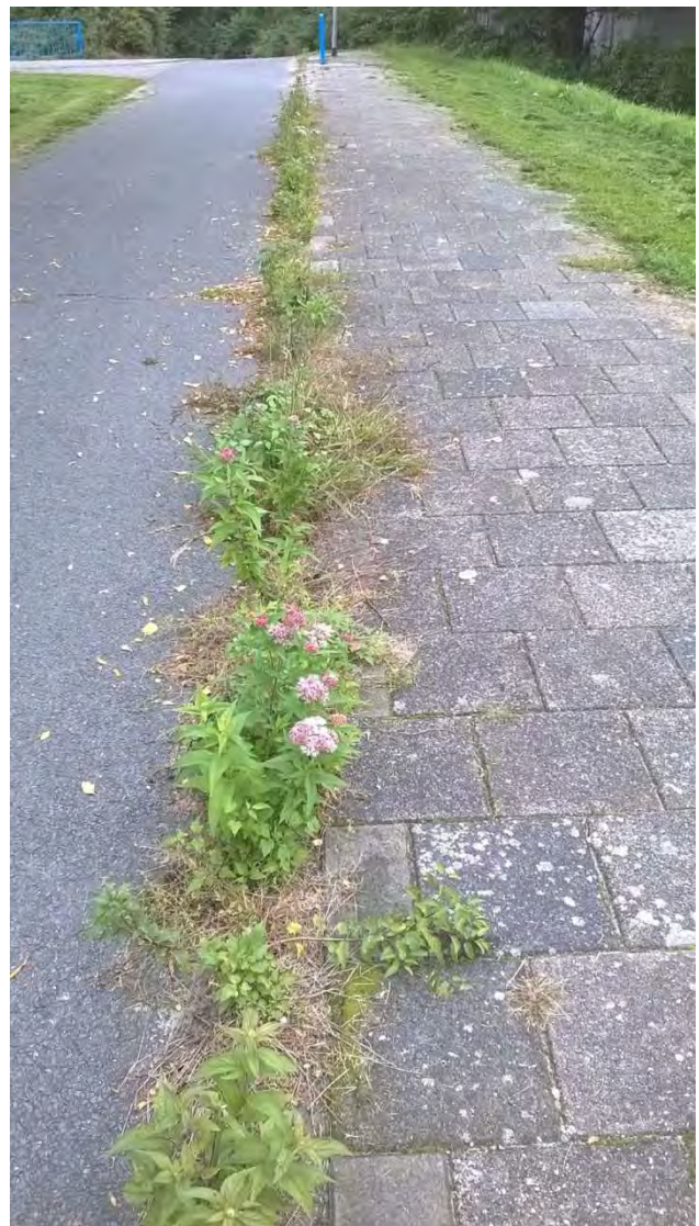
Figuur 3. Nectarbron tussen de verharding.

elke gemeente heeft weer een andere portefeuilleverdeling, soms kan natuur onder 3 wethouders vallen en doen ze allemaal een eigen stukje. Om deze reden is het nuttig om eerst een ambtelijk verantwoordelijke te spreken. Een wethouder kan insecten in de stad hoger 'op de agenda' plaatsen en opdracht geven om aan het onderwerp te werken. Het is wel handig als bijen en of insecten ook in het raadsprogramma opgenomen zijn en de wethouder daarmee een legitimiteit heeft om een plan te maken.