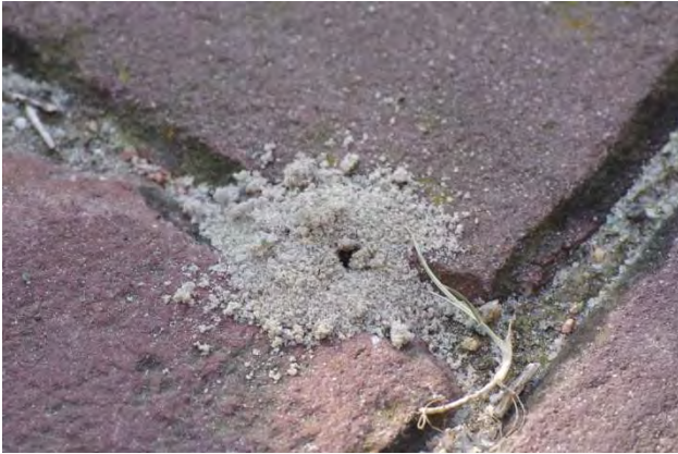
Figuur 2. Nest van een wilde bij tussen de straatstenen.

die vervolgens geen informatie geeft over waarom wespen in de stad toch juist belangrijk zijn om 'plagen' van andere insecten te voorkomen. Oh ja, tegen die andere vervelende insecten koop je natuurlijk weer gif bij het tuincentrum, zonder te beseffen dat je daarmee de predatoren ook doodt en meer overlast krijgt. Plag en plaagdieren tussen quotes: is natuurlijk een