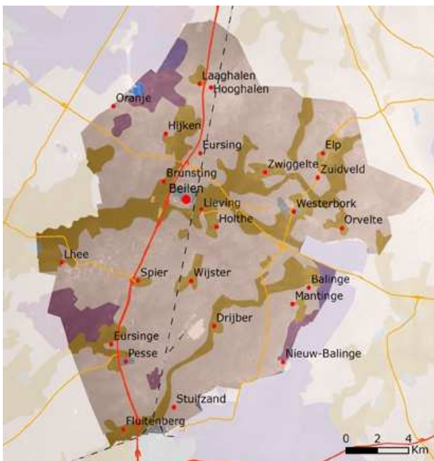
Figuur 1. Kaart van Celtic Fields. Uit: Archeologie & Educatie.