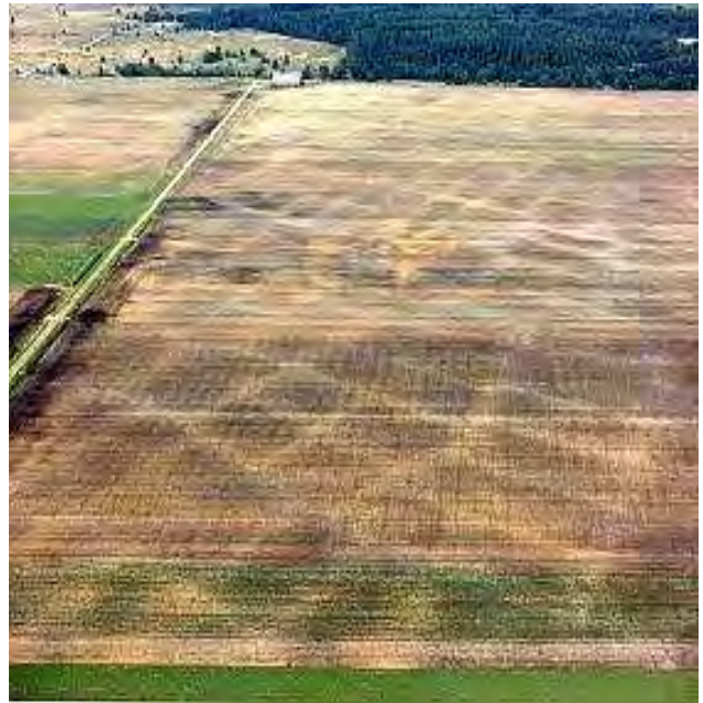
Figuur 2. Luchtfoto van Celtic Fields.

Bewijzen van min of meer vaste bewoning zijn te vinden bij Hijken en Laaghalen (Fig. 1, 2). Deze zogenaamde Celtic Fields, kleine akkertjes, zijn alleen op luchtfoto's nog in het veld te herkennen. De veldjes zijn op meer plaatsen in Drenthe gevonden. Ze dateren uit de ijzertijd, enkele eeuwen voor onze jaartelling.