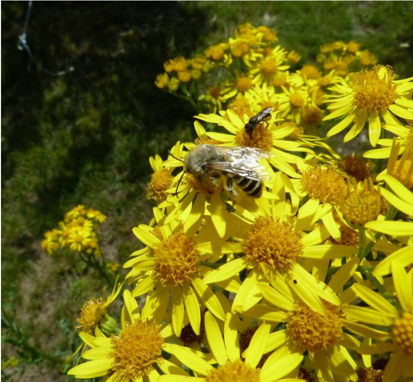
Figuur 5. Een mannetje van de pluimvoetbij en een vrouwtje van de tronkenbij op jacobskruiskruid.

soorten. Inzaaien met zaden van planten die hier niet thuis horen, heeft weinig zin. Beter is het een zadenmix van inheemse planten te gebruiken (Fig. 5, 6). Ook bloemen van bomen zoals wilg en vuilboom zijn een rijke voedselbron voor bijen en andere insecten. Evenals struiken als braam en bessenstruiken. Vaak wordt alles helaas tot de bodem geklepeld en slootkanten zo grondig schoongemaakt dat bijvoorbeeld wederik en kattenstaart nauwelijks meer terugkomen.