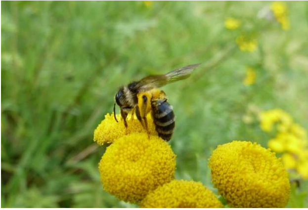
Figuur 6. Zijdebij op boerenwormkruid.