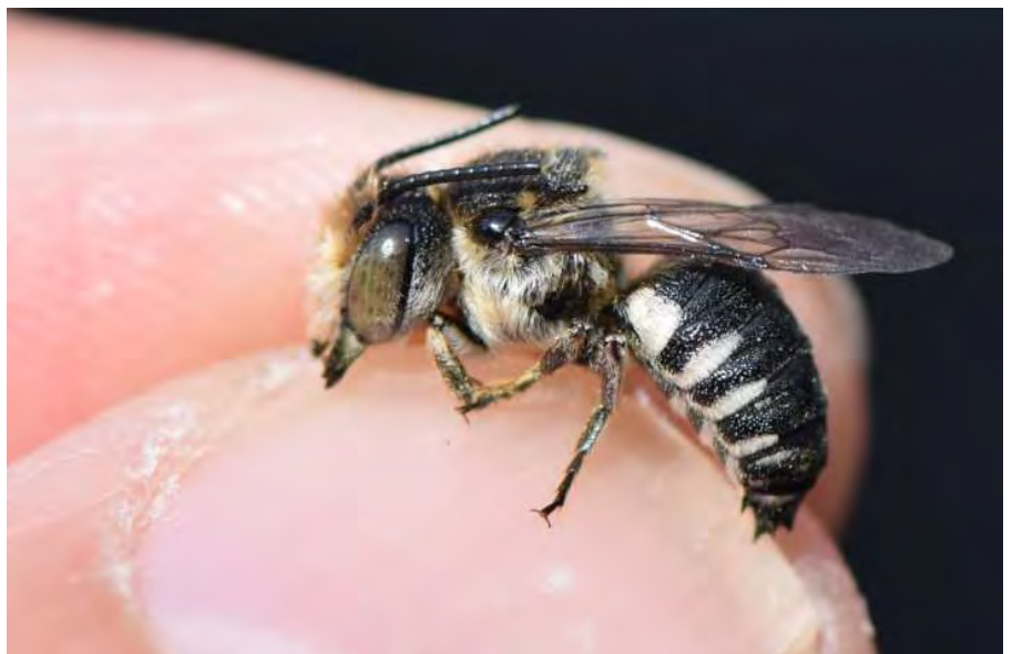
Figuur 4. Man grote kegelbij op 2 juni 2020, de eerste binnenlandse waarneming na 55 jaar afwezig geweest te zijn.

Roodrandzandbij Andrena rosae vrouw op 2 juli 2020 op vlakke kruisdistel. Deze soort staat op de rode lijst als 'bedreigd' maar is dit jaar plotseling op allerlei plaatsen opgedoken.