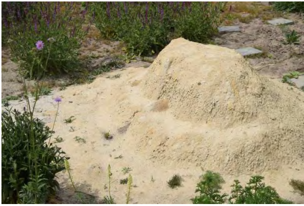
Figuur 3. De bijenheuvel gemaakt van leemhoudend geel zand.

2020 aangelegd en een maand met rust gelaten, zodat het zand goed kon inzakken. In maart hebben we de zandheuvel aangestampt en de steile kanten afgestoken. De heuvel is aan alle kanten afgestoken maar niet overal even steil. We hebben een beetje gespeeld met de vormen en zoveel mogelijk variatie aangebracht. Gedurende het voorjaar en zomer waren er constant veel bijen en wespen op de heuvel aanwezig en hebben veel soorten de heuvel gebruikt als nestgelegenheid. Op zonnige momenten waren vaker 50 tot 100 exemplaren van diverse soorten op de heuvel aanwezig. Soorten waarvan met zekerheid is vastgesteld dat ze in de heuvel genesteld hebben zijn de lathyrusbij Chalicodoma ericetorum , breedbandgroefbij Halictus scabiosae en diverse groefbijsoorten Lasioglossum spec. Met name de Lasioglossum -soorten zorgden voor het aantrekken van enkele bloedbijsoorten Sphecodes spec. en van het geeltipje Nomada sheppardana . Ook de gewone schoorsteenwesp Odynerus spinipes heeft in de heuvel een nest gemaakt evenals diverse soorten graafwespen. Vooral de bijenwolf Philanthus triangulum nestelde er in grote aantallen. De heuveltop werd tevens door diverse soorten gebruikt als opwarmplek en het lemige zand werd met name door veel (plooi vleugel-)wespen verzameld als nestmateriaal.