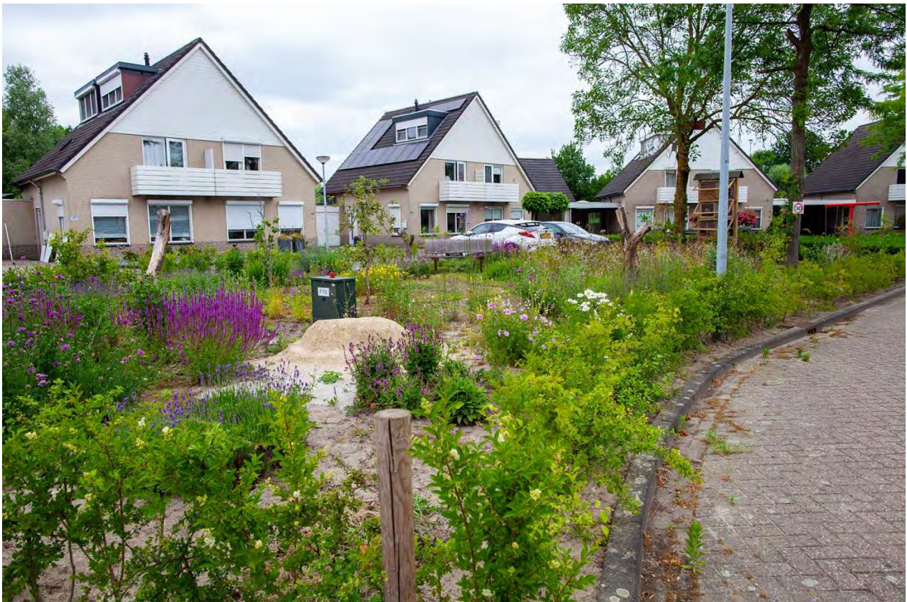
Figuur 1. Overzicht van het plein 'de Bijenoase' aan de Standaardmolen te Weert.

We hebben met de gemeente afgesproken dat we zelf zorgden voor beplanting, aankleding en uitvoering. Alleen het verwijderen van de oude beplanting is