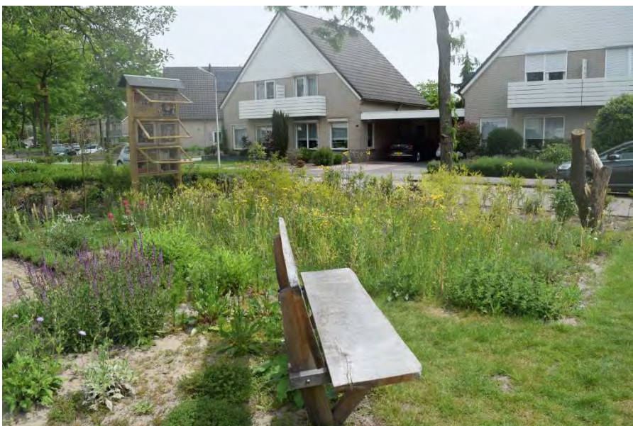
Figuur 2. Ingezaaid bloemveld.

We hebben een bloemveldje (oppervlakte 66 m 2 ) ingezaaid (Fig. 2) met een biologisch zaadmengsel voor droge schrale, bij voorkeur kalkhoudende gronden, aangeschaft op cruydhoeck.nl . We hebben vooral voor dit mengsel gekozen omdat deze het beste past bij de bodem waarop gezaaid is. Van de soorten