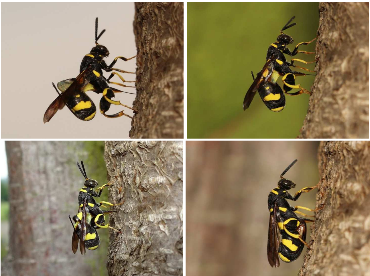
Figuur 3-6. Vrouwte van Leucospis dorsigera aan het boren.