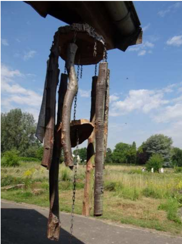
Figuur 1. Nestplaats voor bijen.

De CNME Natuurtuinen Jekerdal Maastricht kende ik van eerdere bezoeken en leek me een goede plek voor de gezochte wesp, dus begaven we ons die dag nog naar die tuinen. Er zijn daar een aantal nestvoorzieningen voor bijen en wespen aangebracht. Bij de ingang van het kleine bezoekerscentrum vielen enkele neerhangende balkjes op die als een soort luiddokken dienden en waar kevergangen in zaten (Fig. 1).